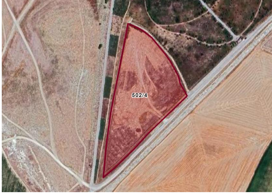
Resim 2. Cihanbeyli Belediyesi Güneş Enerji Santrali Proje Sahası

Bölgede yapılan gözlemler dahilinde ortalama sıcaklık 11,9 °C olarak ölçülmüştür. Ortalama sıcaklıklara bakılacak olursa en sıcak ay Temmuz (24,1 °C) ve en soğuk ay Ocak (-0,3 °C) olarak gözlemlenmiştir. Yine aynı gözlem periyodunda maksimum sıcaklığın 40,6 °C olduğu ve minimum sıcaklığın -11 °C olduğu ifade edilebilir. Ayrıca yıllık ortalama güneşlenme süresi günde 7,4 saat olmak üzere yılda 2,898 saattir.